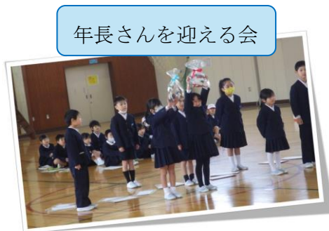
年長さんを迎える会