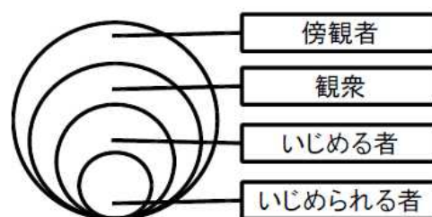
「いじめの四層構造」