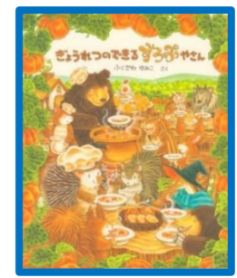
「ぎょうれつのできるすうぶやさん」