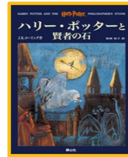
「ハリーポッターと賢者の石」