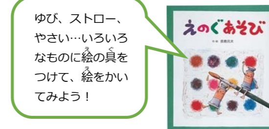
「えのくあそび」岩崎書店