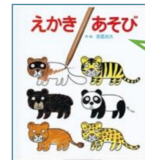
「えかきあそび」岩崎書店

年おいた ロバは、歌がうたえるので、おんがく音楽たいに入ろうとおもいつきました。