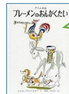
「ブレイメンのおんがくたい」福音館書店

年おいた ロバは、歌がうたえるので、おんがく音楽たいに入ろうとおもいつきました。