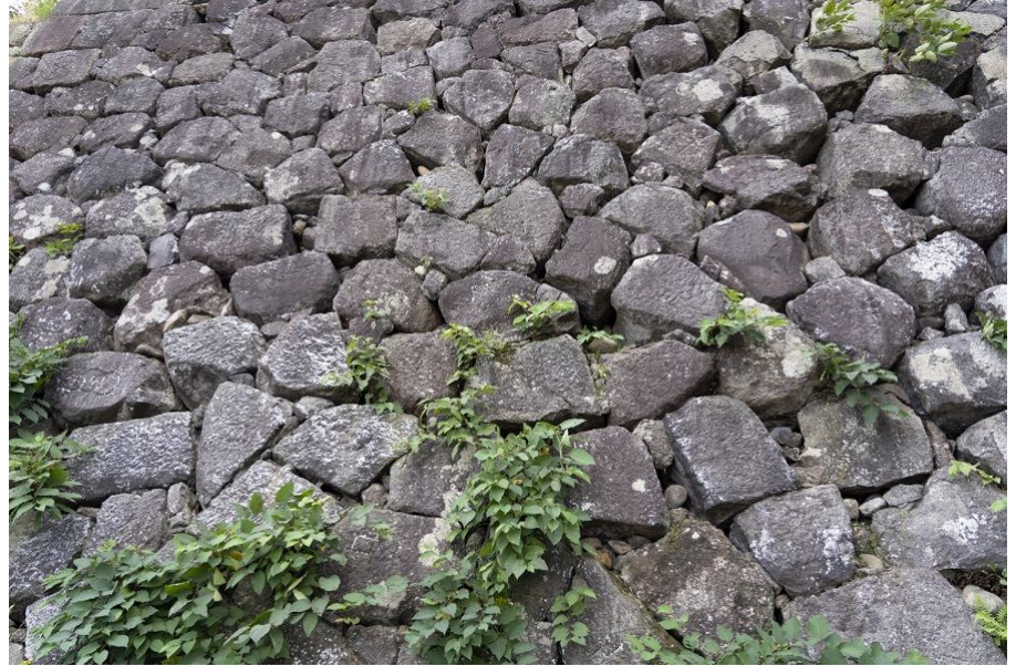
②戌亥櫓(いぬいやぐら)石垣