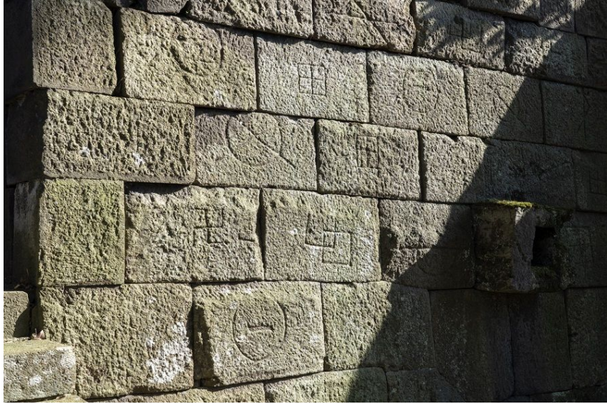
①数寄屋敷(すきやしき)石垣