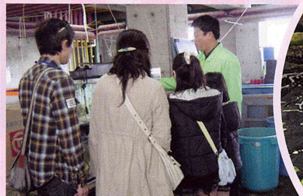
飼育研究棟での解説