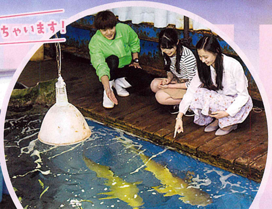
海洋大水槽を裏側から見学