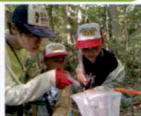
こん虫さいしゅう

昆虫採集をテーマに、山のキャンプ場で1晩過ごします。昆虫探しの為にワナを作ったり、夜中に探したり!?