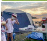
テントもごはんも