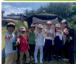
テントでおとまり