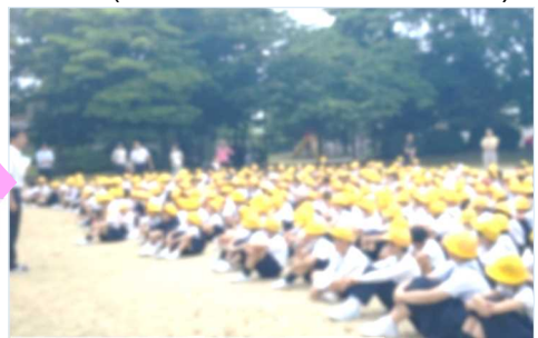
2次避難場所で指示を聞く(全校)