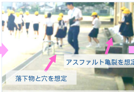
落下物と穴を想定