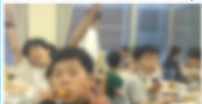
宿泊体験の食事タイム