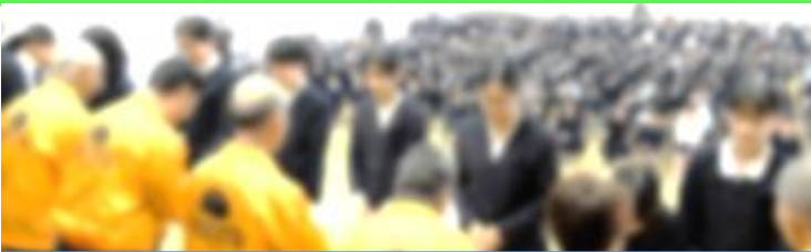
感謝のお手紙渡し（感謝の気持ち手紙に寄せて）