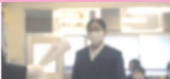
「社会を明るくする標語」賞状授与