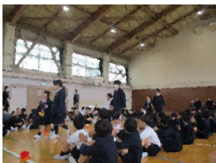
全校合唱の中、6年生と入場