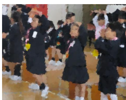
クイズを楽しむ1年生