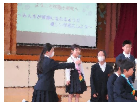
1年生の好きなもの紹介