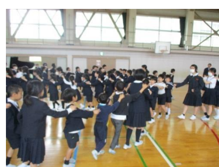
全校でのじゃんけん列車