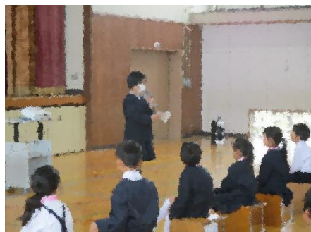
6年生のあいさつや司会