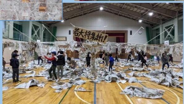
お 終わっ た あとで、新聞紙を 思いっきり びりびり~