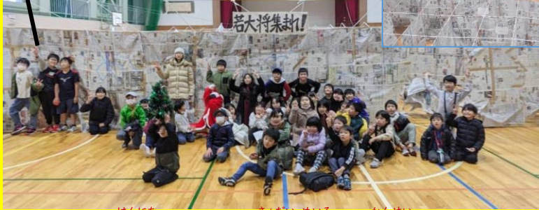
はんじち にかかっ て きょだい めいろ かんせい 半日かかって 巨大迷路が 完成!