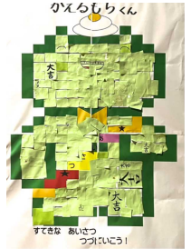
これがカエルもちくんだ!

さて、3学期も、残すところあと30日あまり。子ども達の「がんばった!」という実感とともに、1年間(6年生は6年間)のよいしめくりができるよう、丁寧に指導をしていきます。