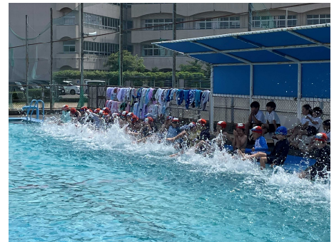
待ちに待った プールでの学習！

さて、7月は1学期締めくくりの月です。この3ヶ月あまりをじっくり振り返り、夏休みのめあてを明確に持ち、「夏休み」が子ども達にとって大きく成長できる日々となるよう指導していきます。ご家庭でもお子様と一緒に、今年の夏休みの安全で有意義な過ごし方については是非話し合ってみてください。