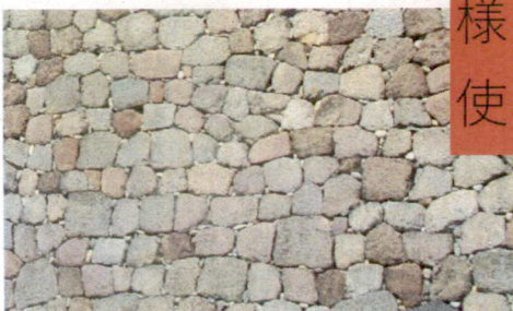
様々な技法が使われた石畳