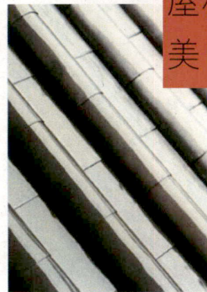
屋根が鉛で美しい