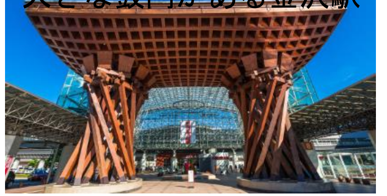
おお つづみもん かなざわえき 大きな鼓門がある金沢駅