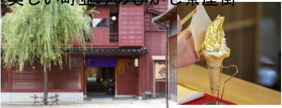
うつく まちなみ ちゃやがい 美しい町並みのひがし茶屋街