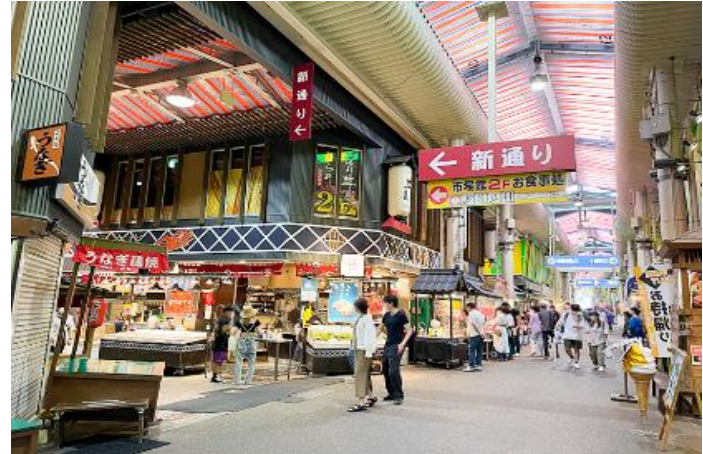
やさいぎょかいるい ほうふ おうみちょういちば 野菜と魚介類が豊富な近江町市場