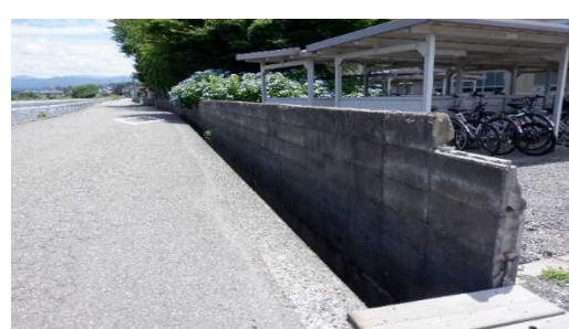
⑦校舎東側ブロック