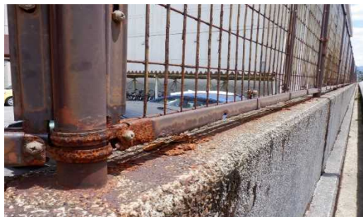
③新体育館周りのフェンス