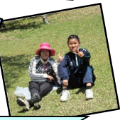
たのしい遠足でした