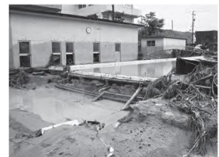
【東浅野小学校のプール】 手前にあったコンクリート製の塀と床と水道設備は隣接する工場へ流された

*金沢「絆」活動とは、「金沢子どもかがやき宣言」に基づく実践を通して、人と人との「絆」を大切にしながら、「心」と「力」を磨く児童会・生徒会活動です。第2次学校教育金沢モデルの柱の一つである金沢「絆」教育の趣旨を継承するとともに、多岐にわたる取組を整理し、①金沢「絆」会議の開催、②金沢「絆」プロジェクトの実施、③金沢「絆」の日の3つの取組により、活動を推進しています。