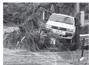
【東浅野小学校付近の路上】 流下物で押し上げられた乗用車