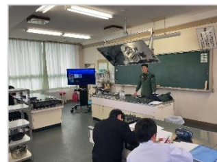
【戦闘機パイロット】