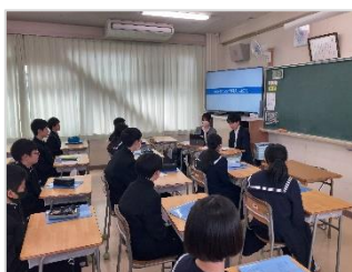
【システムエンジニア】