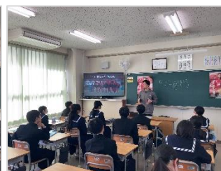
【サッカークラブスタッフ】