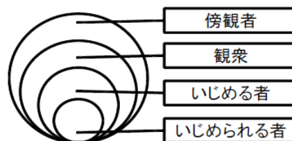
「いじめの四層構造」