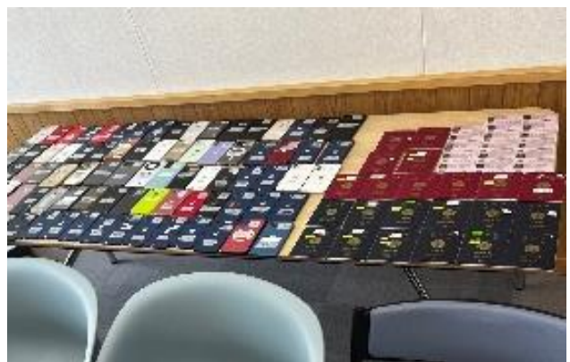
(右) 犯行グループが渡航者から没収していた携帯電話、パスポート、身分証等