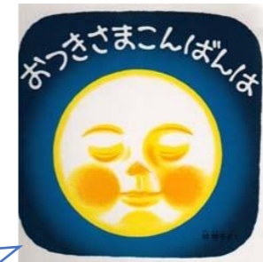
「おつきさまこんばんは」