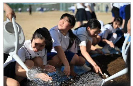
【今回植えた花は、マリーゴールド、ペコニア、インパチェンス、コリウス、ブルーサルビア、ペチュニアです】