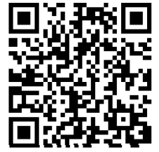
額中 NEW ホームページ

1・2年生も「充実期＝3学期」と位置づける中で、今年度じっくりと身につけてきた資質・能力を、授業の中での制作物やスピーチなどの形でアウトプットできた場面も増えました。詳しくは本校ホームページをご覧ください。