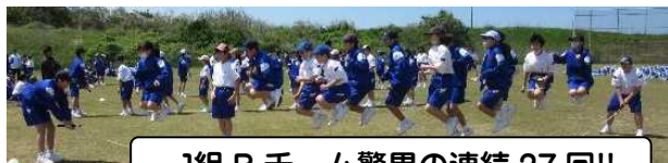
1組Bチーム驚異の連続27回!!

広場に到着すると、まもなくリーダー会によるレクリエーションが始まりました。まずは「大縄跳び」。体育の授業でも練習を何回もして、ある程度コツをつかんでいたはずですが、本番は草の生えた地面で行いましたから、若干難しく感じたかもしれませんね。それでも、どのクラスも味方チームを大きな声で応援して、一緒に回数を数えて、自然と団結していました。中には20回以上連続で跳べたチームもあって感心しました。結果は、1組が合計41回で1位、38回で2位でした。おめでとう!!