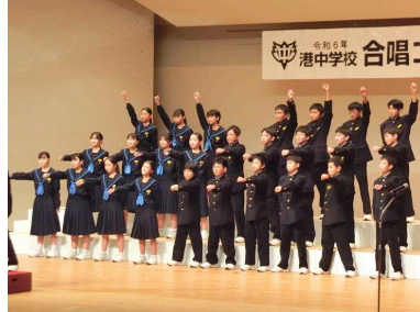
1年2組「怪獣のバラード」