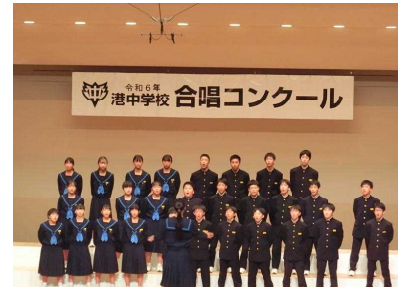
1年5組「マイバラード」